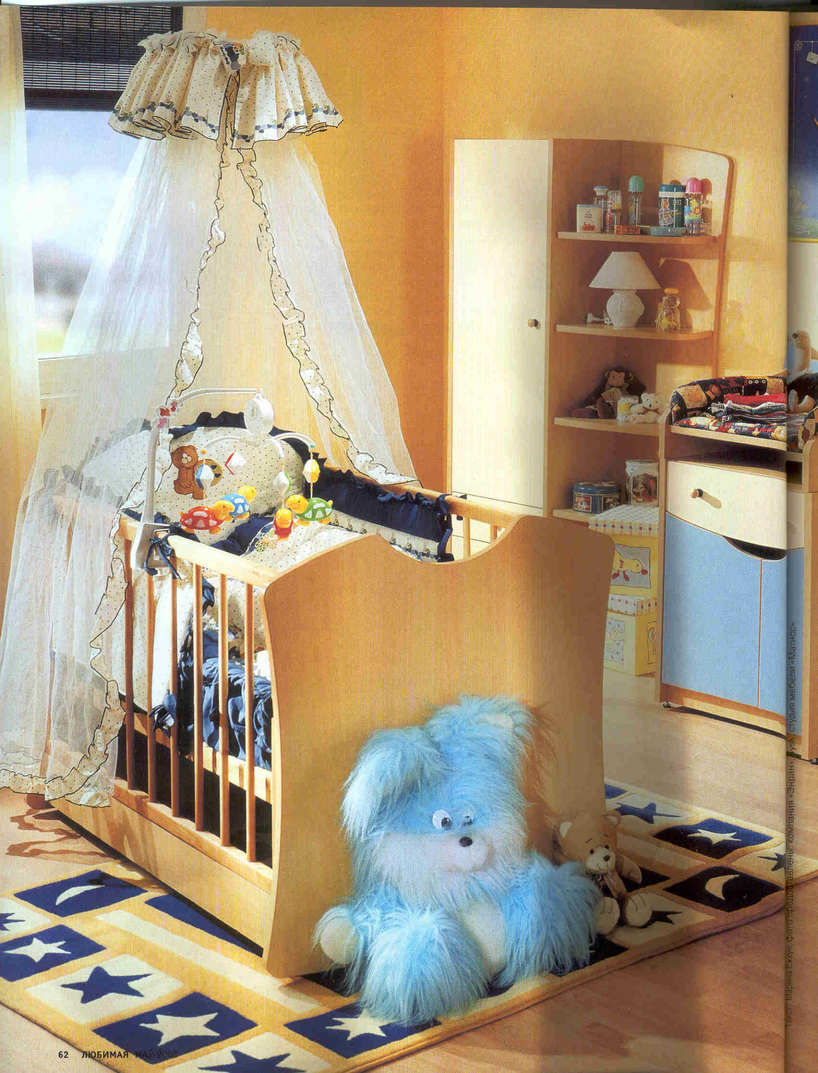
Текст: Марина Ежова, фото: прудко.защелены: компания «Энраи», усок: студия мебели «Матисс»