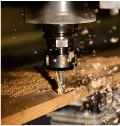
Обробний центр з числовим програмним управлінням здійснює фрезерування криволінійних деталей ДСП, масиву, меблевого щита.