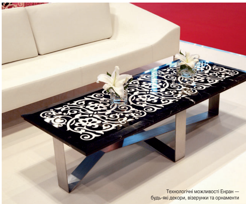
Технологічні можливості Енран — будь-які декори, візерунки та орнаменти